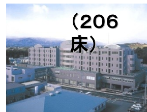
国際医療福祉 大学病院