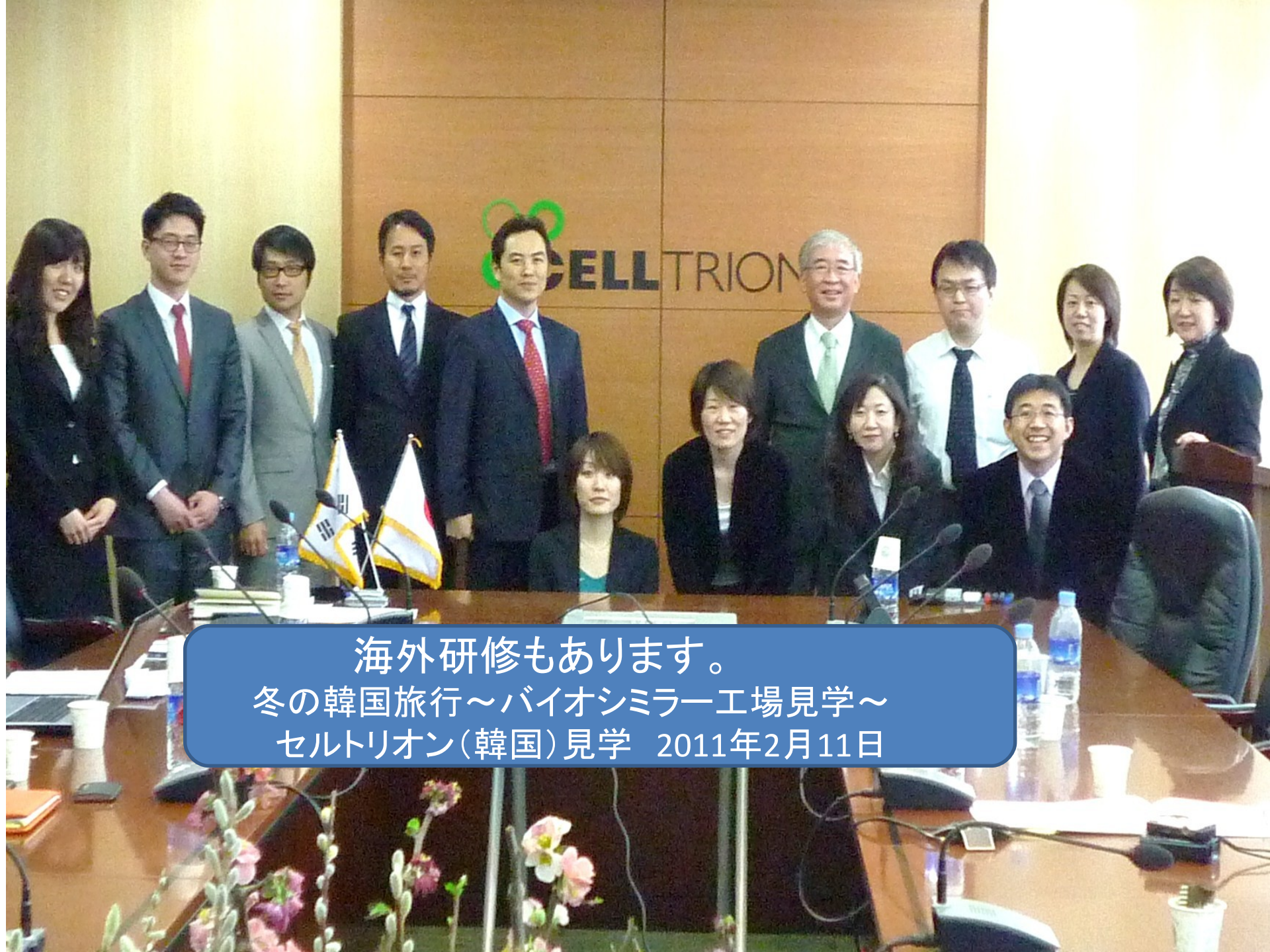
海外研修もあります。 冬の韓国旅行～バイオシミラー工場見学～ セルトリオン(韓国)見学 2011年2月11日